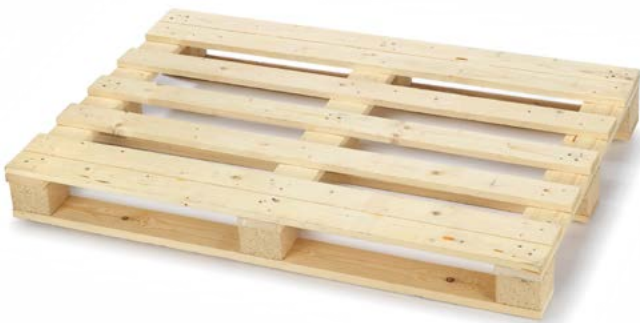
Bancale a quattro vie