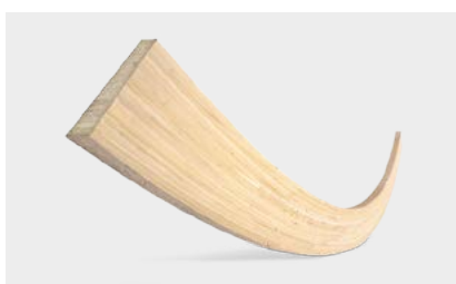
Elementi costruttivi speciali in legno lamellare