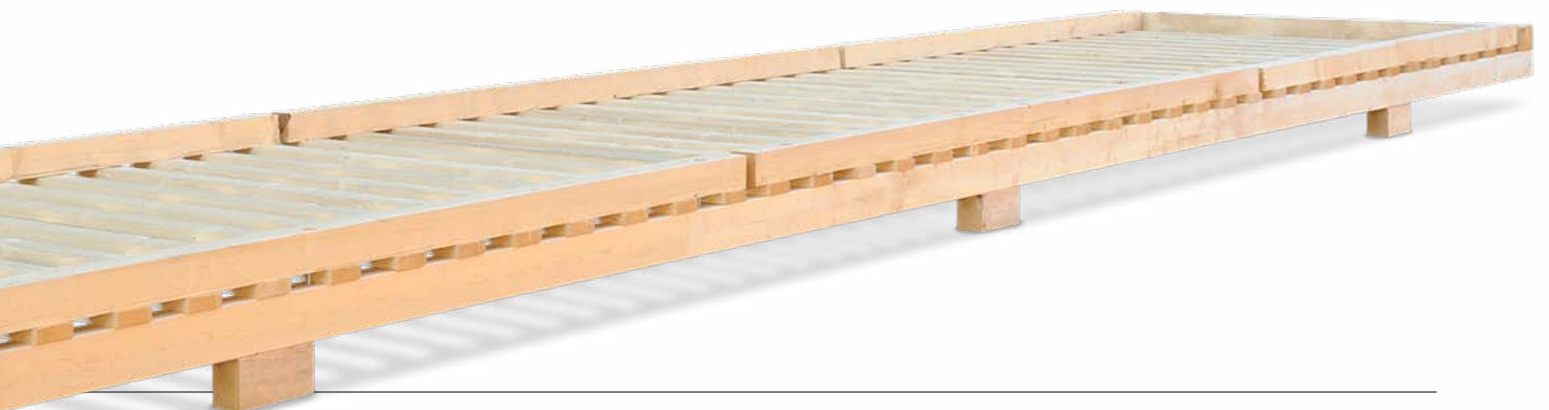
Carrelli per container e imballaggio per carichi pesanti