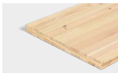
Pannelli in legno massiccio