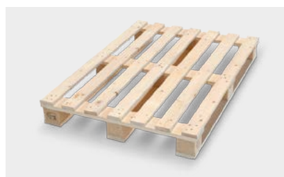
Bancali & soluzioni d'imballaggio