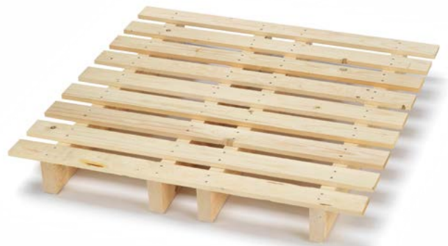
Bancale speciale a due vie