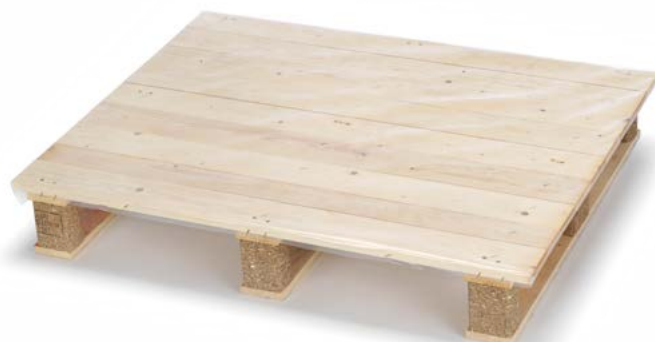
Bancale per carta