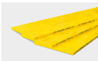
Pannelli per casseforme