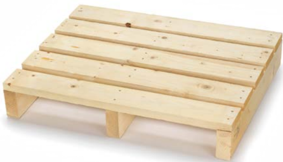
Bancale a due vie