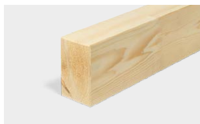
Travi in legno massiccio giuntato & GLT®