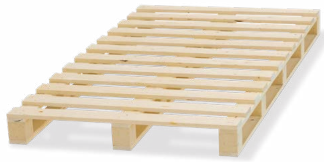
Bancale speciale a 4 vie