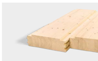
Elementi per solaio in lamellare