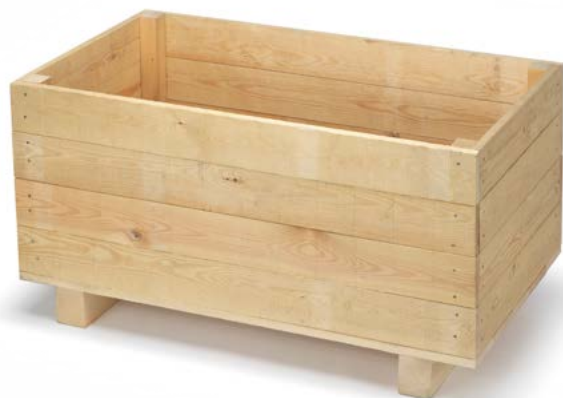
Cassa in legno