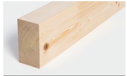
Konstruktionsvollholz & GLT®