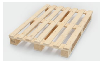
Paletten & Verpackungslösungen